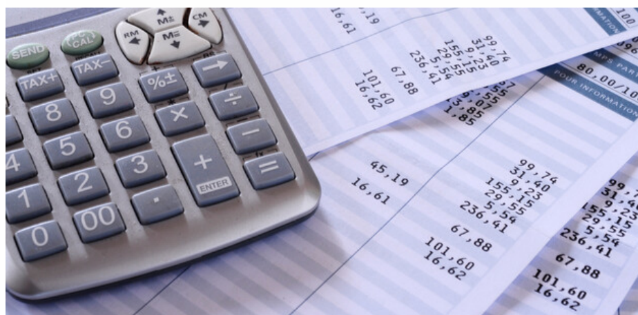
אילוסטרציה | אילוסטרציה: shutterstock, fullempy

חוק שעות עבודה ומנוחה מסדיר את תנאי ההעסקה של עובדים בשעות נוספות. מדובר בחוק קוגנטי אשר למעסיק אסור להתנות עליו בחוזה העבודה שהוא כורת עם העובד. לפי הוראות חוק שעות עבודה ומנוחה, עובד זכאי לקבל גמול מיוחד עבור ביצוע שעות נוספות בעבודה.